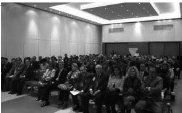
Jornadas Preparatorias en Oberá Misiones

También participaron Jueces de Paz de las restantes provincias del NEA, de la República del Paraguay y del Brasil, quienes en todos los casos destacaron la función mediadora de los jueces de paz, manifestaron preocupación por el aumento en toda la