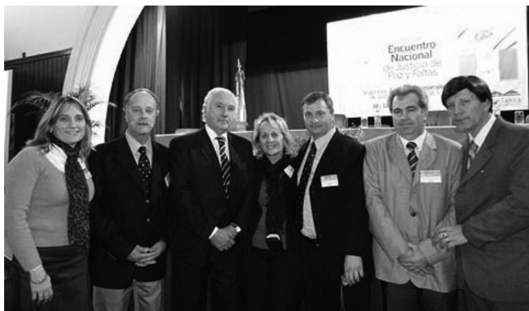
"Primer Encuentro Nacional"

certificaciones, violencia familiar)". Los problemas: falta de mobiliario, sueldos bajos (2000 pesos aproximadamente). "Tenemos a nuestra disposición los aranceles que genera el juzgado para nuestro abastecimiento".